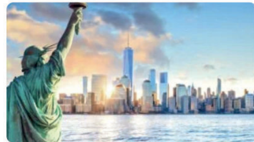
Lugares para visitar en New York