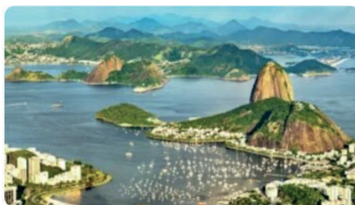
Lugares para visitar en Brasil