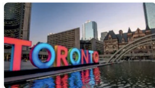
Lugares para visitar en Canadá