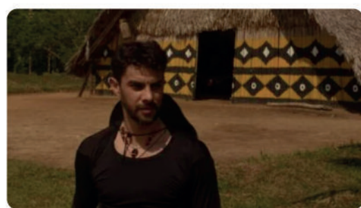
El Vaupes en Todo su Esplendor