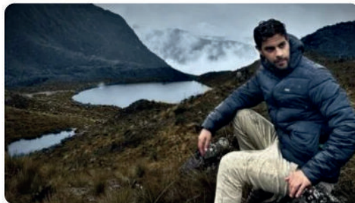
Chitagá, La Mágica Tierra del Durazno y los Páramos.