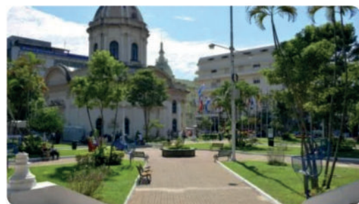
Lugares para visitar en Paraguay